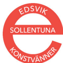
Bild nya logon

Nytt förslag till ny logo togs upp och nytt namn d.v.s. Edsvik Sollentuna Konstvännen . För att stadfästa detta beslut utlyses ett nytt medlemsmöte under våren enligt stadgarna.