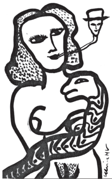
Tuschteckning av Ulrica: ”Min man”

PETTER ZENNSTRÖM är en nyligen avliden konstnär (död 2014) med abstrakt formspråk där färgen ger uttryck åt känslorna. Representerad på flera konstmuseer.