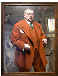
Anders Zorn, självporträtt på Zornmuséet i Mora